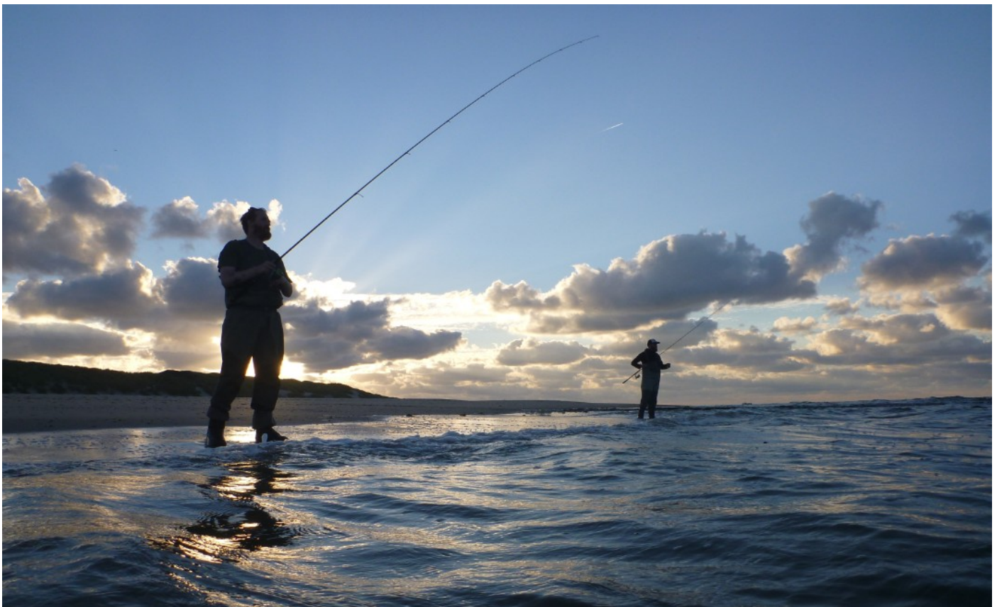
Zeebaarsvissers in actie

Reden voor de EAA-lobby was de conclusie van ICES dat de steeds strengere regels voor de sportvisserij – met een gesloten seizoen van een half jaar en een bag limit van één zeebaars in 2017 – niet tot vermindering van de invloed van de hengelsport op de zeebaarsstand had geleid. Dat kon gewoon niet kloppen en er was ook niemand die dit 'feit' kon verklaren. Uiteindelijk restte de wetenschap niets anders dan haar huiswerk opnieuw te doen.