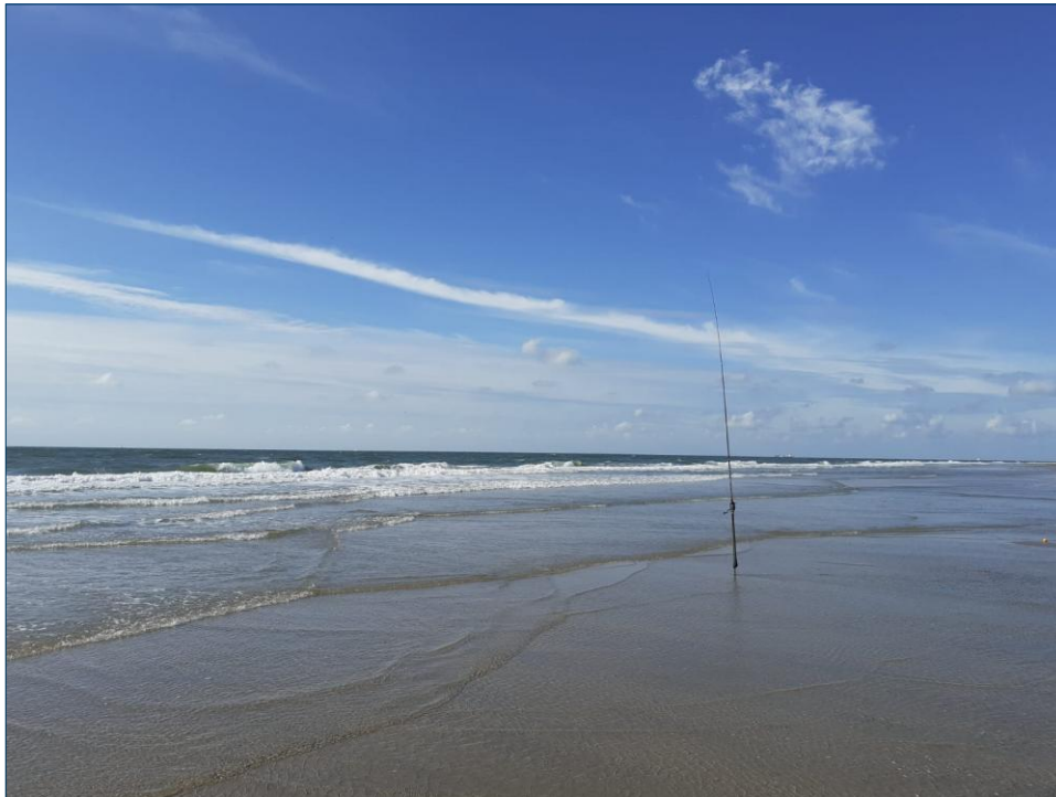
Mooi zeetje !