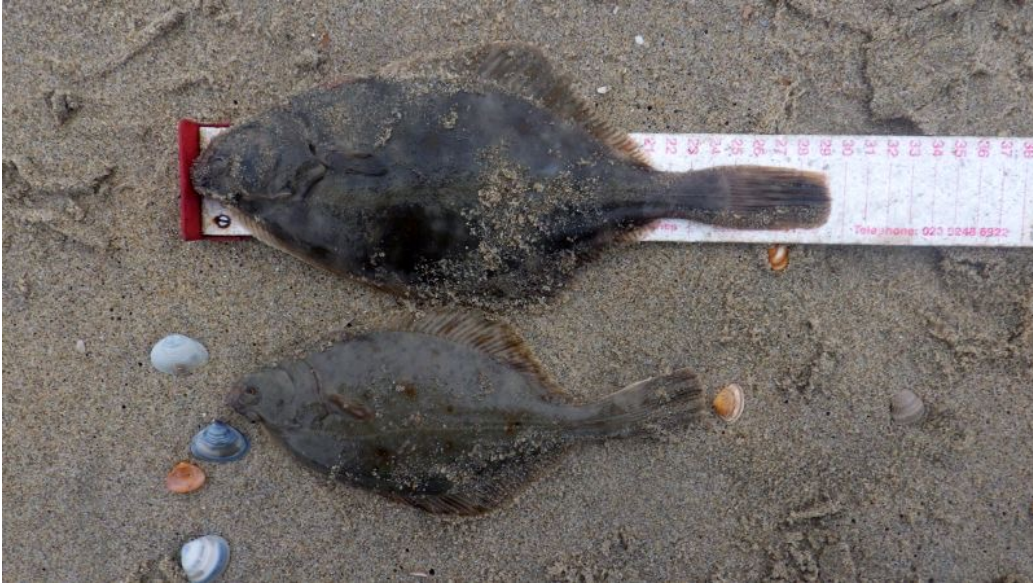
Aardig wat botten en schar!