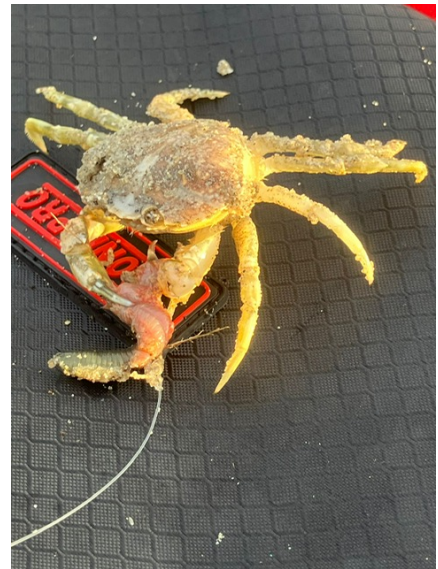
Die zaten er ook nog ondanks de kou !