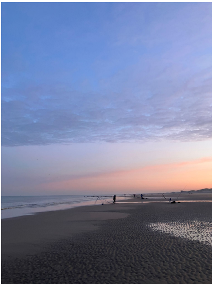
Prachtig weer .